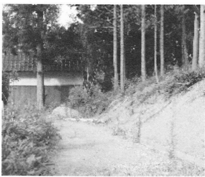
お宮の広場も公園施設として更に利用しやすくなります。