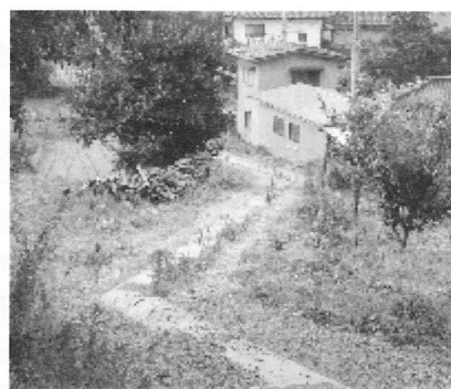
新たに開通した取り付け道路。今後更に改良を進めます。

その間「いきいきふれあいサロン」を立ち上げ、ボランティアの組織を確立して、広く区民お年よりの友好の輪を広げていただきました。本当に永い間ありがとうございました。