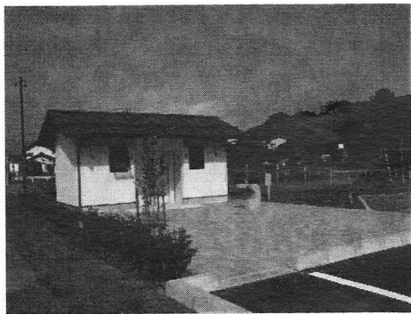
生萱公園のトイレ